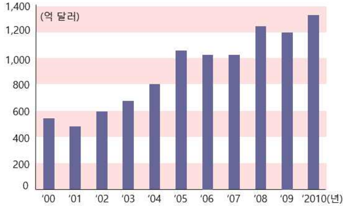
[세계의 공적 개발 원조액]