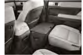
2열 레그룸 박스