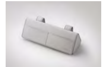
선바이저 선글라스 케이스