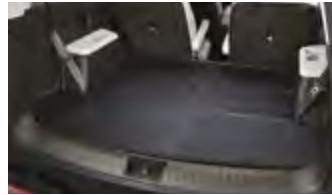
리버서블 러기지 매트