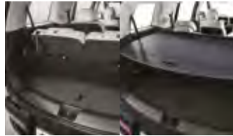
러기지 네트, 러기지 스크린