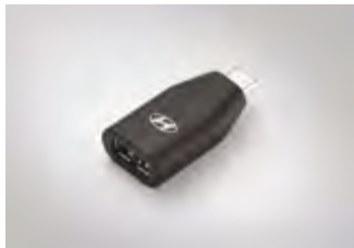
C to USB-A 변환 젠더