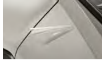
차량 보호 필름 I (프론트 범퍼 사이드 외)