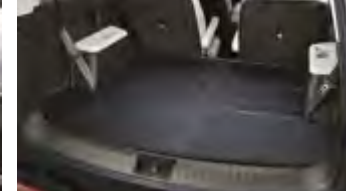
리버서블 러기지 매트