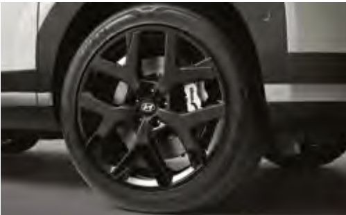
20인치 블랙 휠