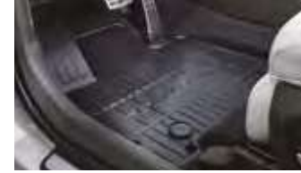
플로어 매트 1, 2열