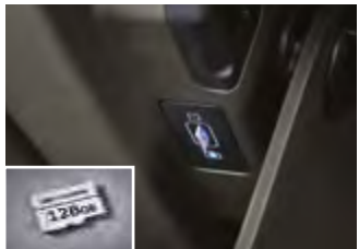
빌트인 캠 2전용 마이크로SD카드(128GB)