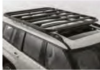
루프 플랫폼 바스켓