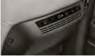
빌트인 공기청정기 2.0