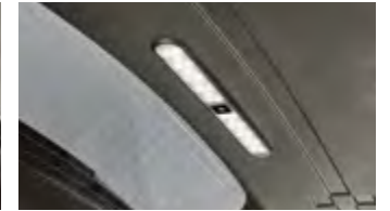
LED 테일게이트 램프