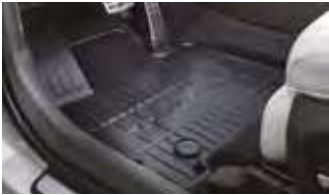
플로어 매트 1, 2열