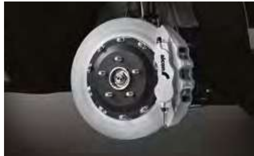
알콘(alcon) 모노블록 브레이크 시스템