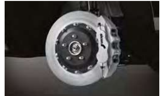
알콘(alcon) 모노블록 브레이크 시스템