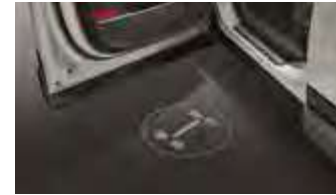
LED 도어스팟 램프