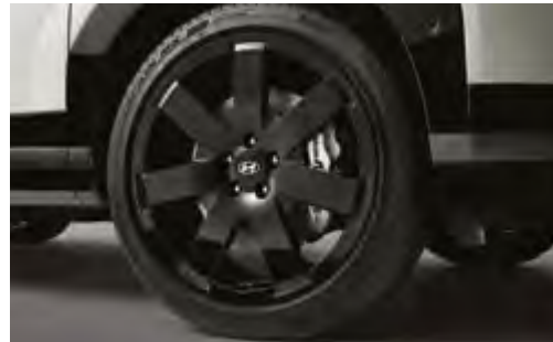
21인치 블랙 휠