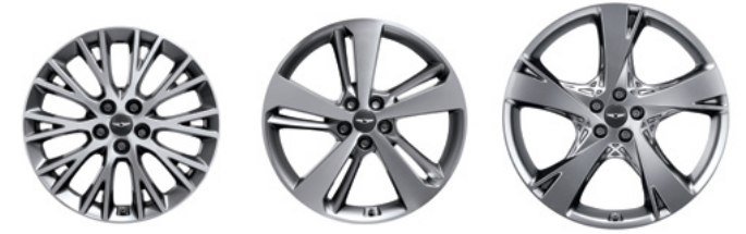
19인치 다이아몬드 커팅 휠