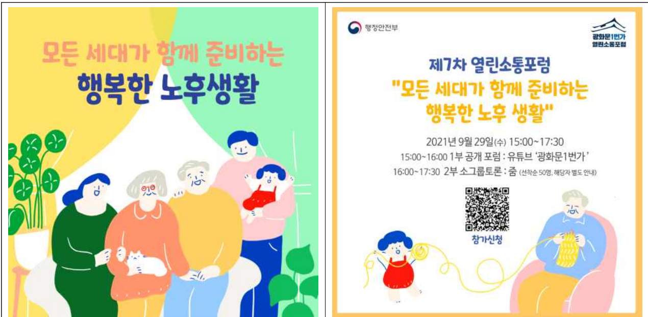
참가신청 QR 코드