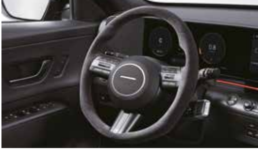
알칸타라 스티어링 휠