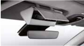
선바이저 선글라스 케이스