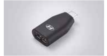
C to USB-A 변환 젠더

※ C to USB-A 변환 젠더는 현대자동차 전용 개발 제품으로 타 제품 및 타 자동차 브랜드에서는 작동을 보장하지 않습니다.