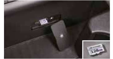
빌트인 캠 2 전용 마이크로SD 카드(128GB)