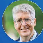
<기조연설 3> 페르난도 레이머스 하버드대학교 포드재단 국제교육실천학 교수