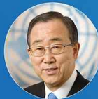
<기조연설 1> 반기문 제8대 UN 사무총장