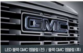
LED 블랙 GMC 엠블럼 (전) / 블랙 GMC 엠블럼 (후)