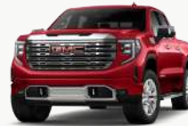
볼케이노 레드 (GNT)