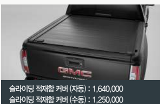
슬라이딩 적재함 커버 (자동) : 1,640,000 슬라이딩 적재함 커버 (수동) : 1,250,000