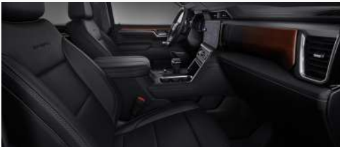
젯 블랙 인테리어