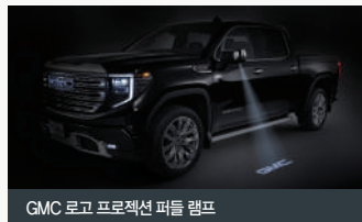
GMC 로고 프로젝션 퍼들 램프