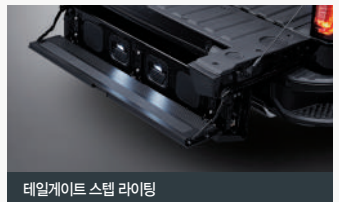
테일게이트 스텝 라이팅