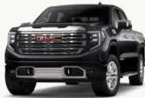
택시도 블랙 (GBA)