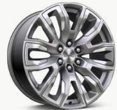
22인치 폴리쉬드 투톤 알로이 휠