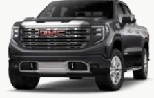
러쉬 그레이 (GBM)

* Denali 선택 가능 외장 컬러 : 아발론 화이트 펠 (G1W), 택시도 블랙 (GBA)