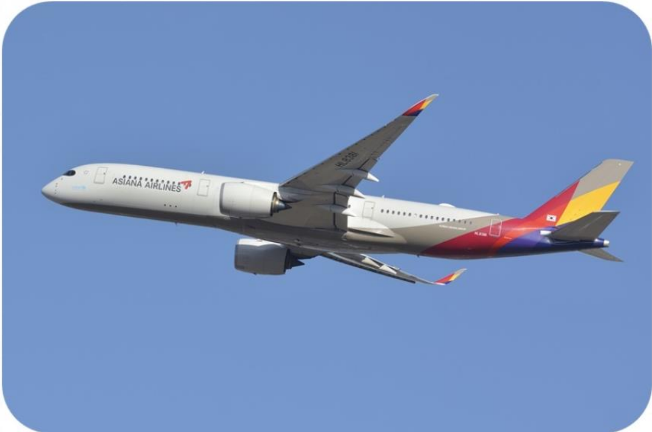
아시아나항공 A350 여객기