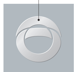
K-eco Silver 바탕