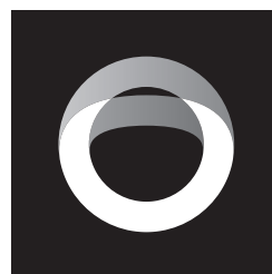
Black 바탕 (흑백)