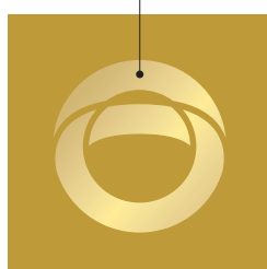
K-eco Gold 바탕