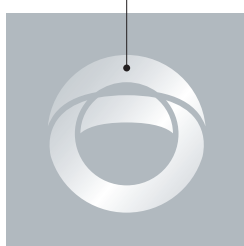
K-eco Silver 바탕