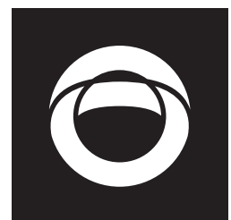
Black 바탕 (흑백) Gradation 표현이 안될 경우