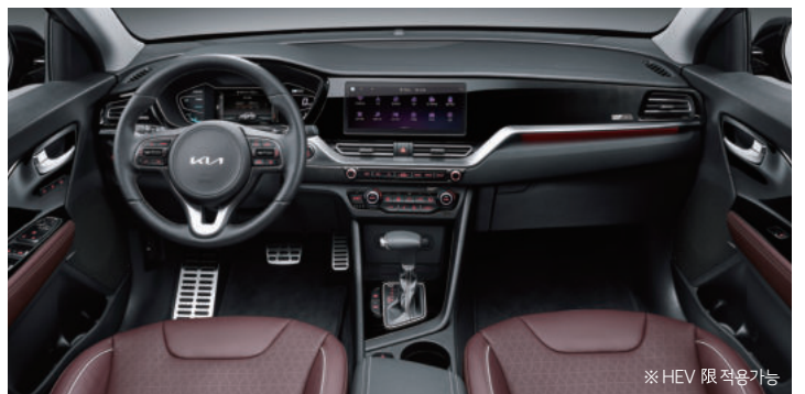
플럼 인테리어(가죽시트) ※ HEV 限 적용가능