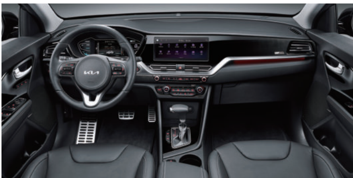
블랙 인테리어(가죽/인조가죽 시트)