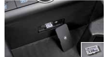
빌트인 캠 2 전용 마이크로SD 카드(128GB)