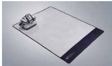
피크닉 매트 & 보냉백