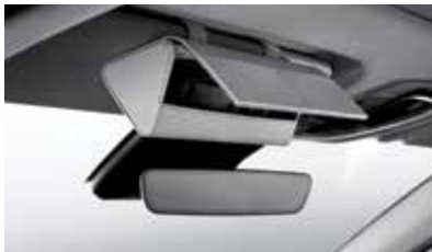
선바이저 선글라스 케이스