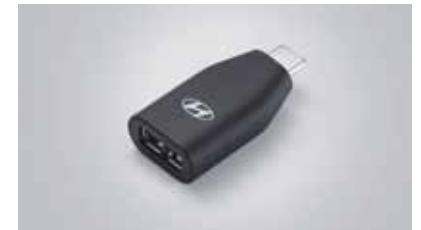
C to USB-A 변환젠더

* H Genuine Accessories 상품 애프터마켓 판매처: 현대 Shop(Shop.Hyundai.com) 현대브랜드관 * C to USB-A 변환젠더는 현대자동차 전용 개발 제품으로 타제품 및 타 자동차 브랜드에서는 작동을 보장하지 않습니다.