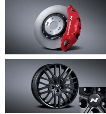
모노블록 4P 캘리퍼 & 하이브리드 디스크 & 로우 스틸 페드 / 19인치 블랙 경량 휠 & 리얼 카본 휠캡