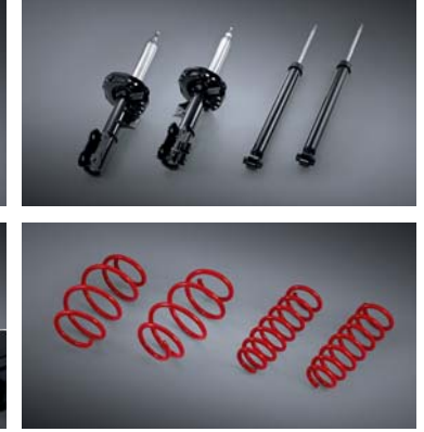
모노튜브 속업쇼버 / 레드 로워링 스프링

※ 위 H Genuine Accessories는 쏘나타 N Line 차량에도 적용 가능합니다. ※ LED 라이팅 플러스 패키지의 도어스팟 램프는 1열에만 적용됩니다. ※ C to USB-A 변환 젠더는 현대차 전용 개발 제품으로 타 제품 및 타 자동차 브랜드에서는 작동을 보장하지 않습니다. ※ N Performance parts, H Genuine Accessories 선택 시 출고센터는 남양, 칠곡 중 선택 가능합니다. ※ 위 상품은 트림 및 옵션 선택에 따라 적용 가능 여부가 달라질 수 있습니다. 자세한 사항은 해당 월의 가격표를 참고해 주시기 바랍니다. ※ N Performance parts 및 H Genuine Accessories 선택 시 기존에 장착된 부품의 처리 비용은 해당 패키지 판매가에 반영되어 있어 별도의 보상은 없습니다.