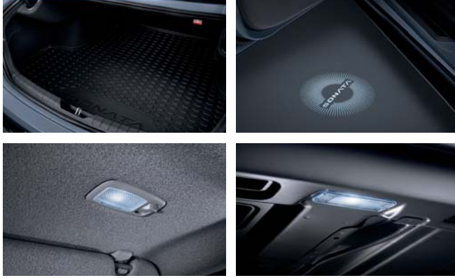
러그지 매트 / 선바이저 램프