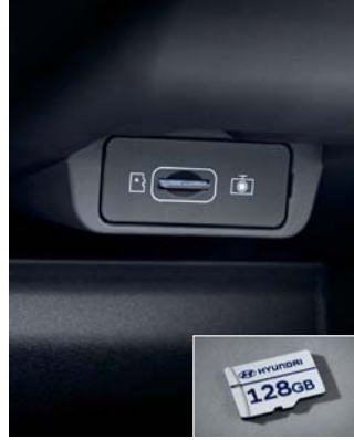
빌트인 캠 2 전용 마이크로SD 카드(128GB)