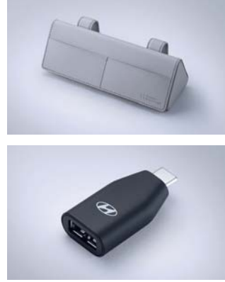
선바이저 선글라스 케이스 / C to USB-A 변환 젠더

※ 커스터마이징 상품 애프터마켓 판매처 - 현대 Shop(Shop.Hyundai.com) 현대 브랜드관