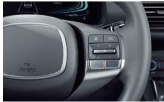
가죽 스티어링 휠(열선포함)