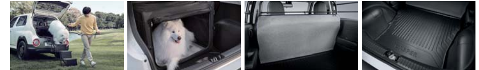
반려견 사다리 켄넬 파티션 보드 방오 커버 2열 방오매트