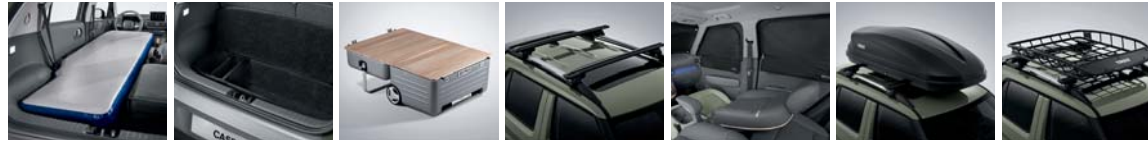
에어 매트 러기지 박스 캠핑 트렁크 크로스 바 멀티 커튼(전면/1열/2열) 루프 박스 루프 바스켓