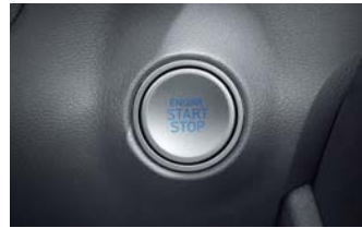
버튼시동 & 스마트키