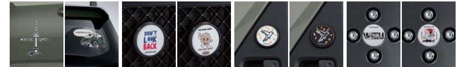
데칼(대형) / 데칼(중형) 그릴 뱃지 리어 도어 뱃지 휠캡

*동승석 시트백 보드 트레이와 동승석 시트백 보드 테이블은 스토리지 옵션 선택 시 장착 가능합니다. *동승석 시트백 보드 테이블을 차량 내부에 장착 시 동승석 시트백 보드 트레이가 먼저 장착된 상태에서 장착이 가능합니다. *공간활용의 기술 / 여행의 정석(for Camping) 카테고리 내 루프 박스, 루프 바스켓, 러기지 박스는 모두 동일한 상품입니다. *액티브 플러스 옵션 적용 시 루프 박스 장착이 불가능합니다. *루프 바스켓에 물건을 적재하여 주행 시 루프 바스켓 상단에 카고 네트 설치를 권장하며, 루프 박스는 내비게이션 미선택 차량에 적용되는 폴안테나와 간섭이 발생하는 점 참고하시기 바랍니다. *에어 매트는 좌측 사용을 기준으로 제작되었으며, 필요 시 2개를 좌우 대칭으로 설치하여 활용 가능합니다. *에어 매트 사용 시, 러기지 공간으로 인해 완전 평탄화가 되지 않습니다. 러기지 박스 상품을 결합하면 평탄화에 도움이 될 수 있습니다. *스토리지 옵션 적용 차량에서 에어 매트 사용 시, 시트백 보드로 인해 동승석쪽은 완전 평탄화가 되지 않습니다. *루프 박스, 루프 바스켓, 사이드 어닝, 크로스 바는 VAN차량에 장착 불가능합니다. (루프백 적용 차량에 장착 가능) *보냉백 & 피크닉 매트 상품에 동승석 시트백 보드 테이블은 포함되지 않습니다. (별도 구매 상품) *Hyundai by Me는 고객 맞춤형 액세서리 제작 서비스로 현대 Shop(shop.hyundai.com)에서 이용 가능합니다. *상기 이미지는 예시 이미지로, 품목 구매 시 원하는 디자인 시안 선택 및 문구 입력이 가능한 상품입니다. *데칼은 소형/중형/대형 사이즈로 선택이 가능합니다. *반려견 사다리는 VAN이 아닌 일반 차량에도 적용이 가능합니다.