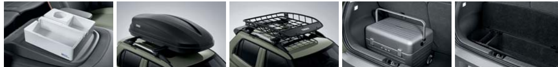
동승석 시트백 보드 트레이 루프 박스 루프 바스켓 캠핑 트렁크 러기지 박스