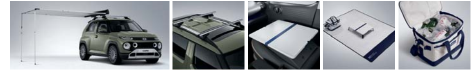
사이드 어닝 크로스 바 (사이드 어닝 전용) 동승석 시트백 보드 테이블 피크닉 매트 보냉백