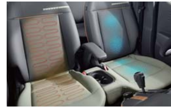
앞좌석 열선시트 / 운전석 통풍시트