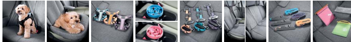
H Genuine 하네스 I 시트커버 쿠션(4열) (차량용, 소형/중형) H Genuine 하네스 II 컵홀더(일상생활용, 소형/중형) 안전벨트 테더, ISOFIX 안전벨트 동승석 시트커버(4열) / 방오시트커버(2열) 목줄, 리드줄 (소형/중형) 포터블 포켓(먹이용/배변용) & 멀티 파우치