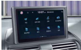
8인치 내비게이션(블루링크, 폰 프로젝션, 현대 카페이) / 후방 모니터