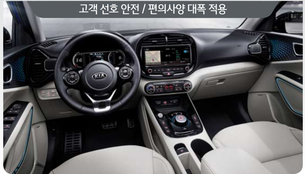
고객 선호 안전 / 편의사양 대폭 적용