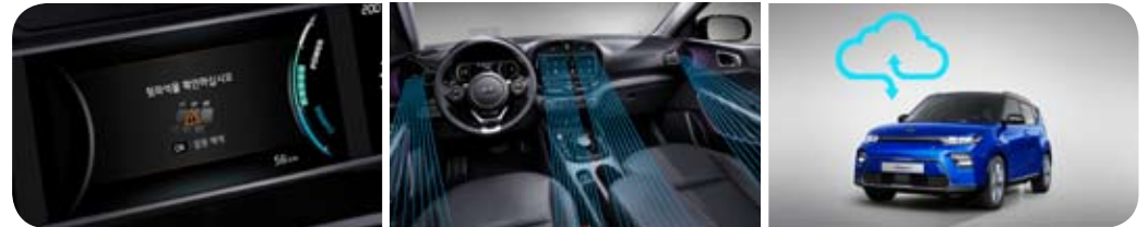
후석 승객 알림

※ 서울 소재 500세대 이상 아파트 및 주변 시설 빅데이터 분석 결과, '20년 3월 환경부 및 오픈넷 제공 정보 기준