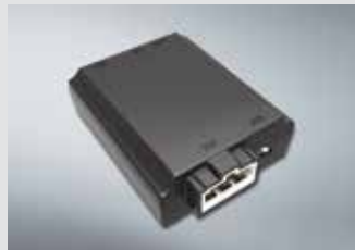
에어컨 습기 건조기 160,000원