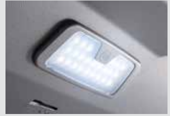
테일게이트 LED 램프 120,000원