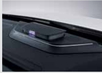
플로팅 센터 스피커 390,000원