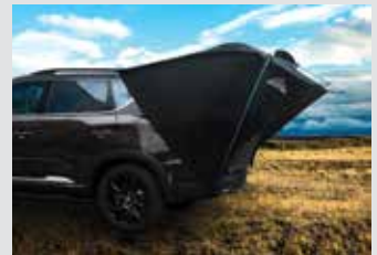
차박용 텐트 380,000원