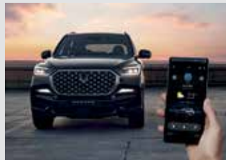
디지털 스마트 키 320,000원