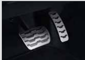
스포츠 페달 40,000원