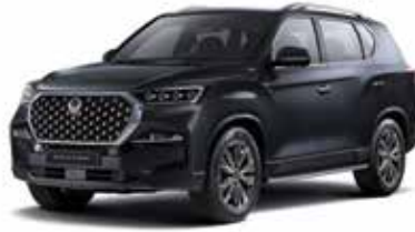
갤럭시스 그레이 ADB