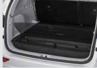
러기지 트레이(5인승 전용) 70,000원