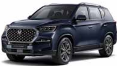
아틀란틱 블루 BAU

* 실키 화이트 펄 익스테리어 컬러는 노블레스 트림과 더 블랙 트림에서 선택 가능 * 본 가격표에 수록된 제품의 색상은 인쇄된 것이므로 실제 색상과 다소 차이가 있을 수 있습니다.