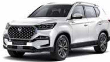
실키 화이트 펄 WAK