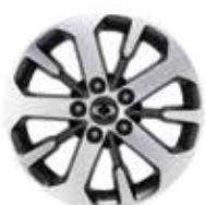
18인치 다이아몬드 커팅 휠