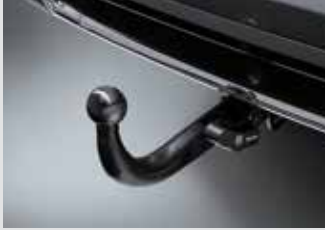
트레일러 히치 13핀(BRINK) 1,200,000원