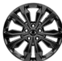
뉴 디자인 20인치 다크 슈퍼링 휠