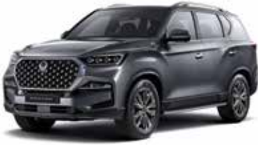
마블 그레이 ACM