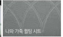
카키 인테리어 (블랙 헤드라이닝)