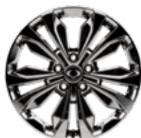
뉴 디자인 20인치 슈퍼링 휠