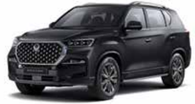
스페이스 블랙 LAK