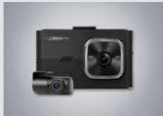
아이나비 블랙박스(16GB) 220,000원