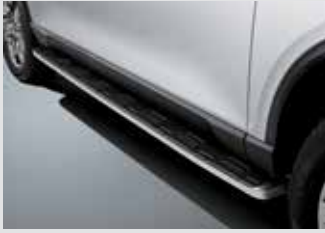
고정식 사이드 스텝 360,000원