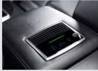
빌트인 공기청정기 370,000원