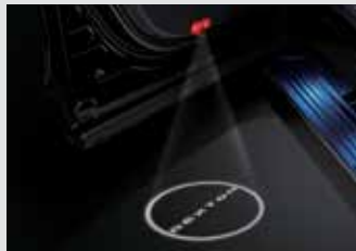
도어 스팟램프 110,000원