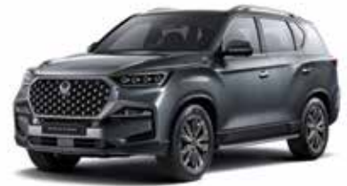
엘리멘탈 그레이 ACY