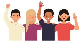
친구 네 명