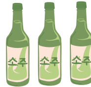
소주 세 병