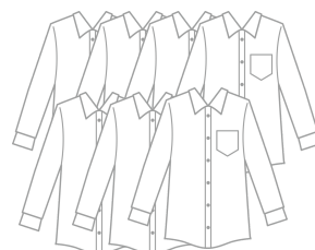
셔츠 일곱 장