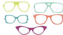
안경 다섯 개