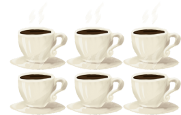
커피 여섯 잔