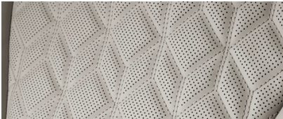
코튼 베이지(퀵팅 나파가죽 - 4인승 후석 전용)