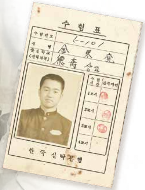
만 17세 나이에 가족 생계를 위해 지원한 첫 직장 수험표