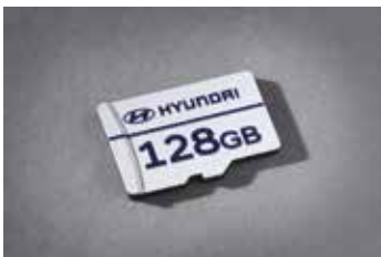
빌트인 캠 2 전용 마이크로SD 카드(128GB)