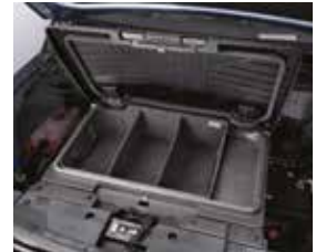
포터블 프렁크 정리함