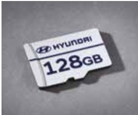
빌트인 캠 2 전용 마이크로SD 카드 (128GB)