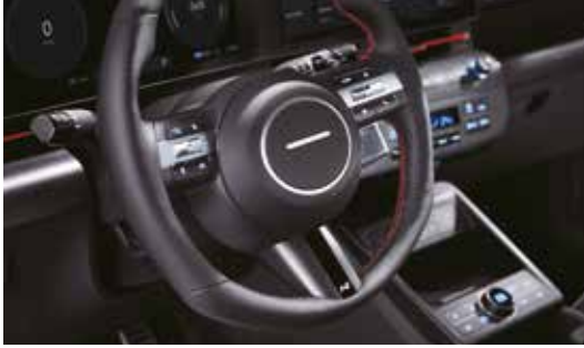
알칸타라 스티어링 휠