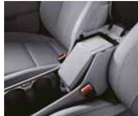
포터블 콘솔 정리함