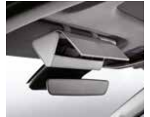
선바이저 선글라스 케이스