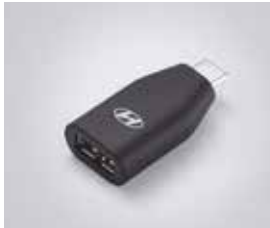
C to USB-A 변환 젠더