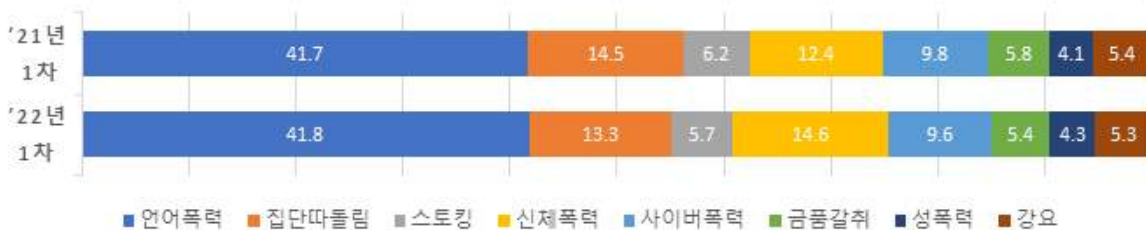
【 (2021년~2022년) 피해유형별 비중(%) 】