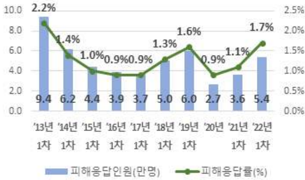
【 피해응답인원 및 응답률 】