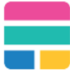
엘라스틱 스택(Elastic Stack)

RESTful API를 통해 검색을 단순화하고 수천개의 노드까지도 확장할 수 있는 높은 성능의 솔루션을 제공합니다