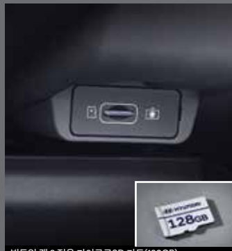
빌트인 캠 2 전용 마이크로SD 카드(128GB)