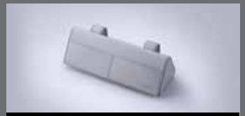
선바이저 선글라스 키스