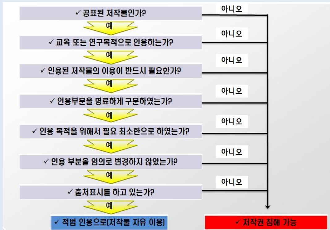
[그림 3.2] 공표된 저작물 인용 시 체크 사항

출처의 명시는 저작물의 이용 상황에 따라 합리적이라고 인정되는 방법으로 하여야 하며, 저작자의 실명 또는 이명이 표시된 저작물인 경우에는 그 실명 또는 이명을 명시하여 야 할 것