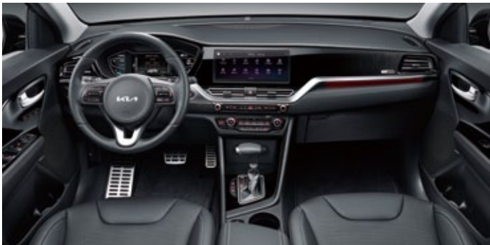
블랙 인테리어(가죽/인조가죽 시트)