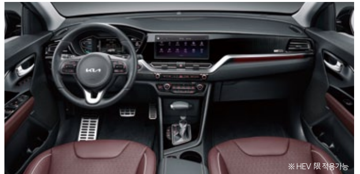
플럼 인테리어(가죽시트) ※ HEV 限 적용가능