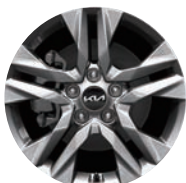
17인치 알로이 휠