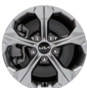
16인치 알로이 휠