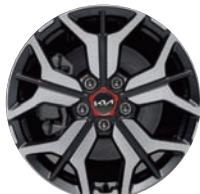
18인치 전면가공 휠