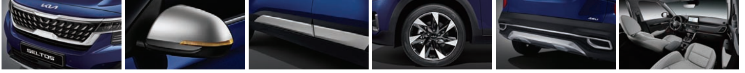
그라비티 전용 라이에이터 그릴 메탈릭 실버 칼라 아웃사이드 미러 커버 메탈릭 실버 칼라 도어 가니쉬 18인치 블랙 전면가공 휠 그라비티 전용 리어 스킵드 플레이트 그라비티 전용 그레이 인테리어(인조 가죽)

※ 시그니처 그라비티 선택 시, 광주 출고센터로만 배정이 가능하며, 출고 후 장착 기간은 약 2일 소요됩니다.