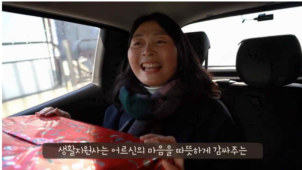
보이는 것 video