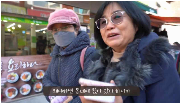
들리는 것 audio