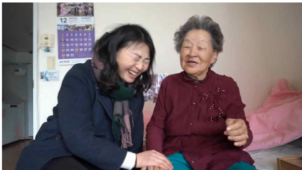
들리는 것 audio

sov)생활지원사는 어르신께 마음을 따뜻하게 감싸주는 ‘날씨요정’ 이라고 생각합니다.