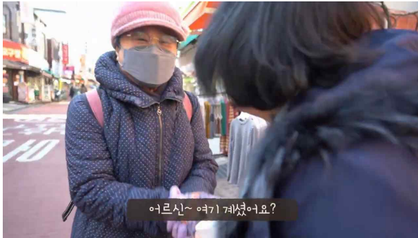
보이는 것 video