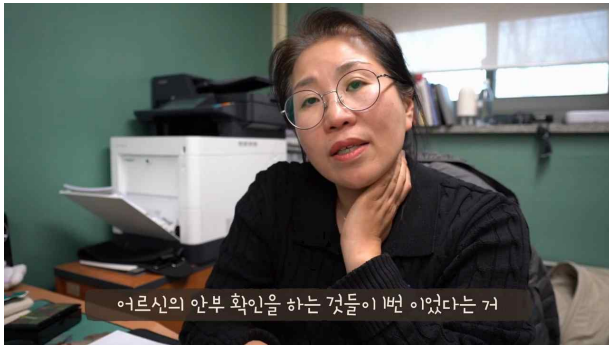
보이는 것 video