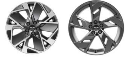
19인치 다이아몬드 컷팅 휠