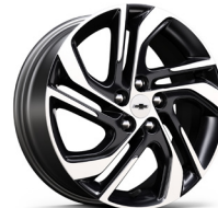
17 인치 머신드 블랙 톤톤 알로이 휠