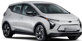
퓨어 화이트 (GAZ)