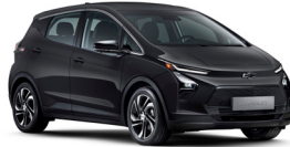
미드나이트 블랙 (GB8)