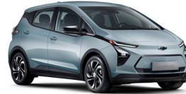
아이스 블루 (G7X)