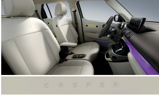
베이지/카키브라운 투톤(인조가죽 시트 / 버터 옐로우 포인트)

※ 베이지/카키브라운 투톤 인테리어는 '실내 컬러 패키지(뉴트로 베이지)' 선택 시 적용 가능합니다.