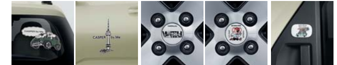
데칼 휠캡 리어 도어 핸들 범퍼

* 동승석 시트백 보드는 컴포트 옵션 선택 시 장착 가능합니다. * 우산스탠드, 동승석 시트백 보드 테이블 2.0, 동승석 시트백 보드 트레이 2.0은 동승석 시트백 보드가 설치되어 있어야 장착 가능합니다. * 동승석 시트백 보드 트레이 1.0은 동승석 시트백 보드와 동승석 시트백 보드 트레이 2.0이 설치되어 있어야 장착 가능합니다. * 동승석 시트백 보드 트레이 2.0은 동승석 시트백 보드와 피드백 구조(자석)로 결합이 되는 상품입니다. * 에어백 스토리지는 동승석 시트백 보드 트레이 2.0에 결합하여 사용이 가능하며, 결합 해제 후 휴대하여 사용도 가능합니다. * PET 히팅 패드 상품 사진에 나와있는 카시트는 현대Shop(shop.hyundai.com)에서 별도 구매 가능합니다. * Hyundai by Me는 고객 맞춤형 액세서리 제작 서비스로 현대Shop에서 이용 가능하며, 상기 이미지 외에도 원하는 디자인 시안 선택 및 문구 입력을 통해 커스터마이징이 가능합니다. * 데칼은 소형/중형/대형 사이즈 중 선택이 가능합니다.