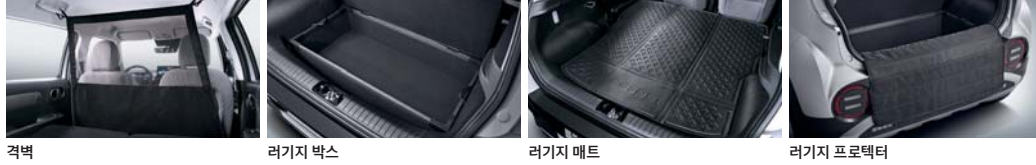
격벽 러기지 박스 러기지 매트 러기지 프로텍터