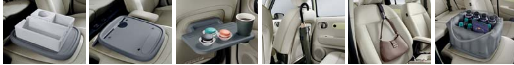
동승석 시트백 보드 트레이 1.0 동승석 시트백 보드 트레이 2.0 동승석 시트백 보드 테이블 2.0 우산스탠드 가방걸이 에어백 스토리지