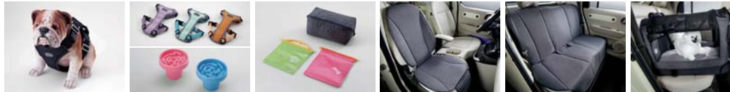
하네스 I (차량용, 소형/중형) 하네스 II (일상생활용, 소형/중형) / 컵홀더토이(1/2열 공용) 멀티 파우치 & 포터 포켓 (먹이용/배변용) 동승석 방오시트커버(1열) 방오시트커버(2열) PET 히팅 패드