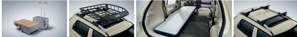
캠핑 트렁크(로우로우) 루프 바스켓 에어 매트 크로스 바