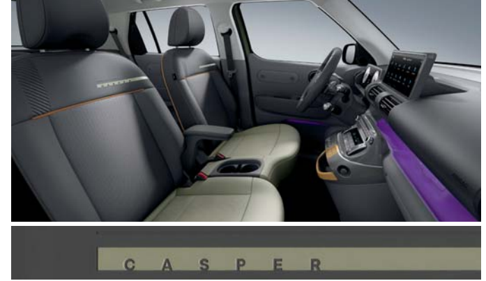
다크 그레이 원톤(인조가죽 시트 / 파스텔 오렌지 포인트)

※ 베이지/카키브라운 투톤 인테리어는 '실내 컬러 패키지(뉴트로 베이지)' 선택 시 적용 가능합니다.