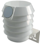
W-Station 본체 및 전원선

우측의 구성품을 함께 제공합니다. 구성품 분실시 분실된 구성품에 대한 배상책임은 귀하(사용자)에게 있습니다.