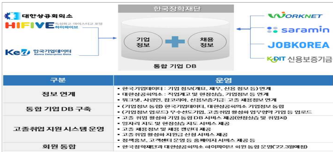
【고졸취업 지원 시스템 구축 및 운영 체계도】