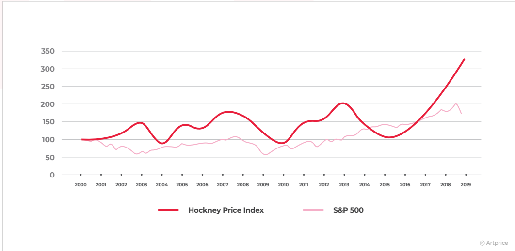
[Artprice David Hockney Price Index & S&P 500 Index]