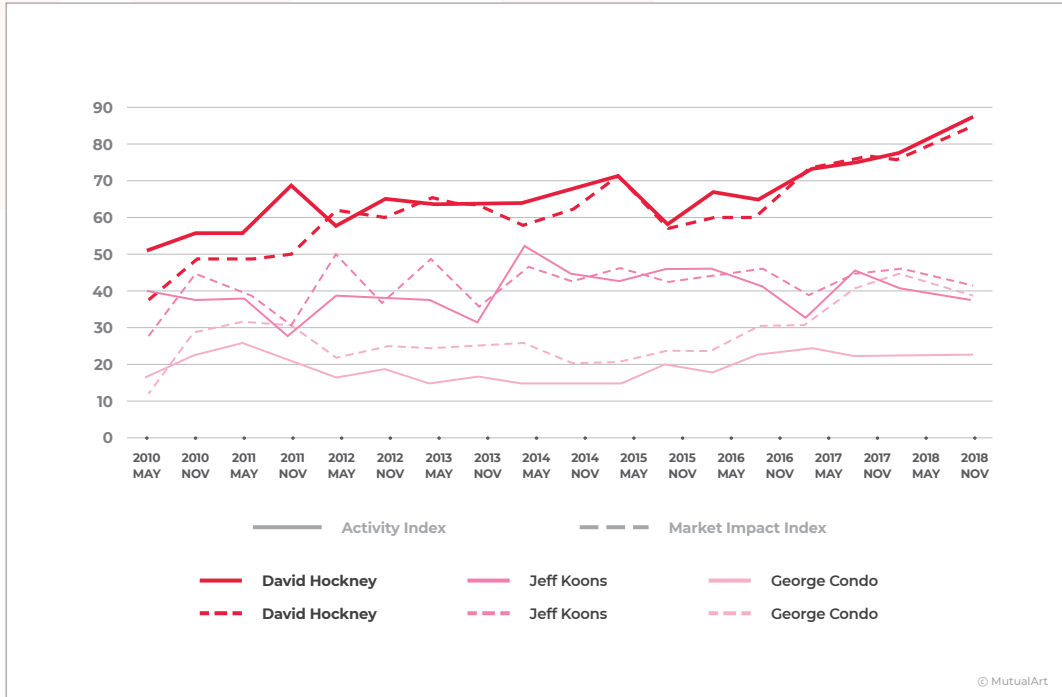
[Market Impact & Activity Comparison: David Hockney, George Condo, Jeff Koons]

지표(미디어 노출도, 시장 관심도, 소비자 경매 참여율 등)를 종합했을 때, 호크니의 영향력은 제프 쿤스, 조지 콘도, 척 클로스 등 동시대 주요 현대미술 작가들을 압도한다.