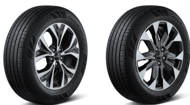
235/60 R18 타이어&전면가공 휠