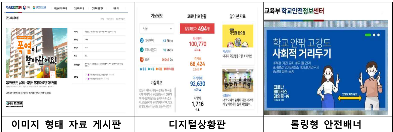
이미지 형태 자료 게시판