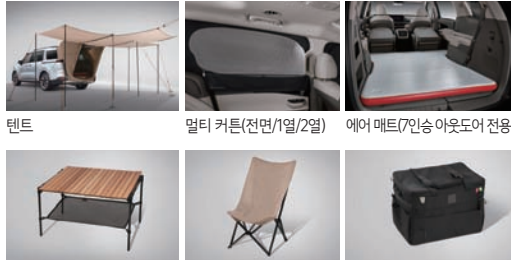
캠핑 텐트, 캠핑 테이블, 캠핑 의자, 캠핑용 수납 가방