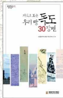
자료로 보는 우리 땅 독도 30장면