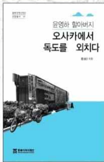
운영하 할아버지, 오사카에서 독도를 외치다