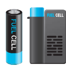
연료전지 Fuel Cell