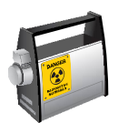
방사선 투과검사 장비 Radiographic Test Equipment