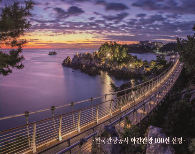
· 한국관광공사 야간관광 100선 선정 ·