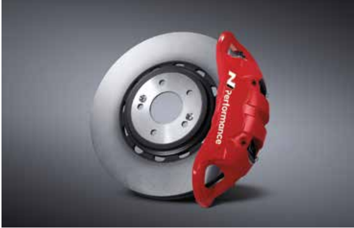
모노블록 4P 캘리퍼 & 하이브리드 디스크 & 로우 스틸 패드