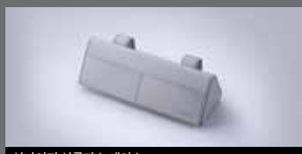
선바이저 선글라스 케이스