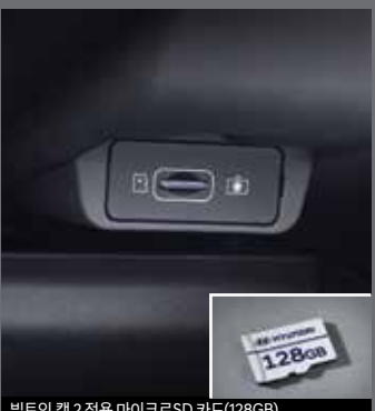
빌트인 캠 2 전용 마이크로SD 카드(128GB)