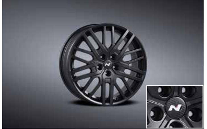
19인치 블랙 경량 휠 & 리얼 카본 휠캡