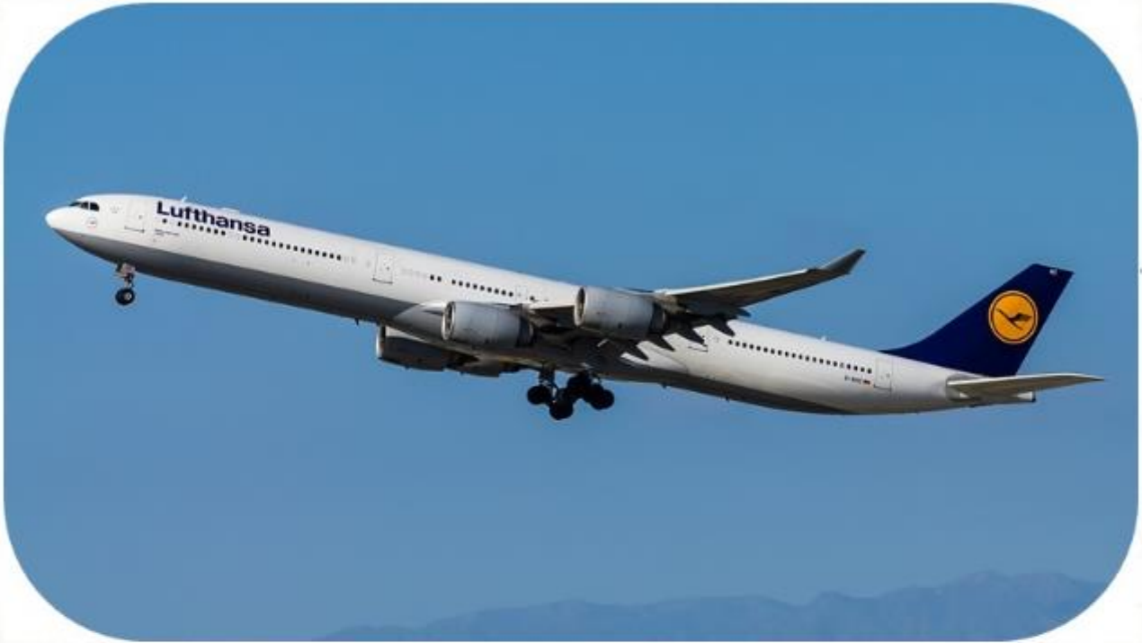
에어버스 A340 여객기