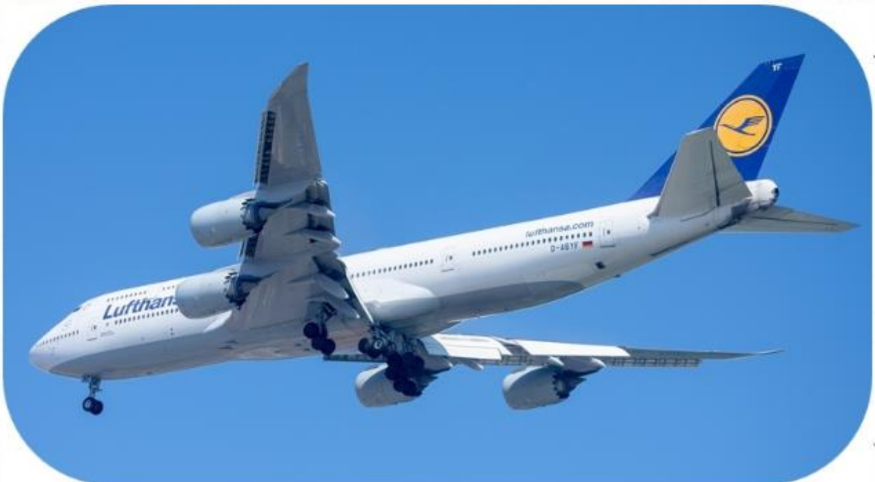
보잉 B747-8 여객기