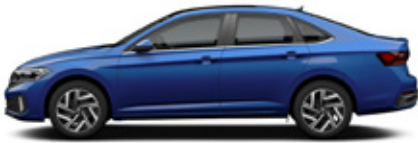
Rising Blue Metallic