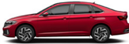
Kings Red Metallic