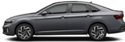
Platinum Gray Metallic