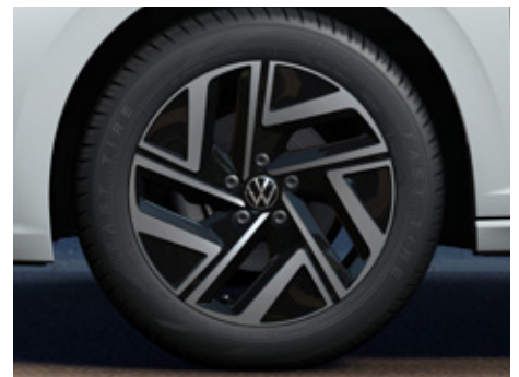
7J x 17" alloy wheels 205/55 R17 tyres