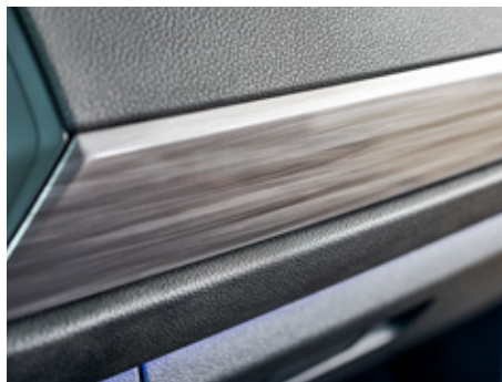
Sliced Metal Brush