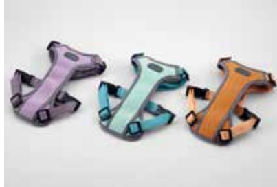
하네스 II (일상생활용, 소형/중형)