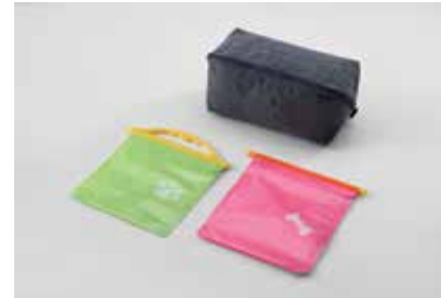
멀티파우치 & 포터블 포켓(먹이용/배변용)

* 커스터마이징 상품 애프터마켓 판매처: 현대 Shop(Shop.Hyundai.com) 현대브랜더관