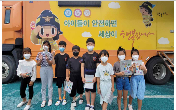
안전 체험 차량