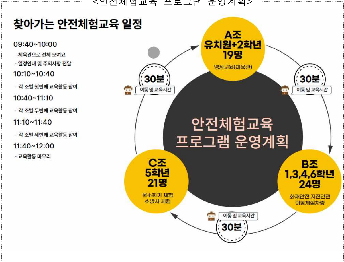
<안전체험교육 프로그램 운영계획>