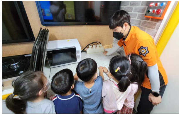
화재 안전 교육