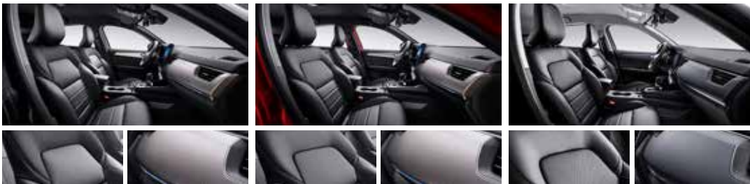
블랙 가죽시트 (RE, INSPIRE 선택) 하이드로 핵사곤 데코 (RE, INSPIRE) 블랙 헤드라이너 & 골드 스티치 (RE, INSPIRE)