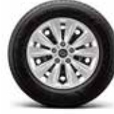
16" 스틸 휠