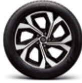
18" 다이나믹 블랙 투톤 알로이 휠