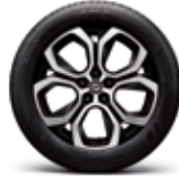
18" 블랙 투톤 알로이 휠