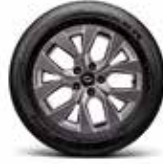
17" 다크 그레이 휠