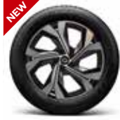
18" 다이나믹 블랙 투톤 터티드 골드 액센트 알로이 휠