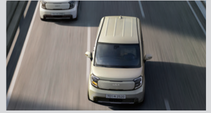
후측방 충돌방지 보조