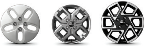
14인치 스틸 휠 (폴사이즈 휠커버) 14인치 알로이 휠 15인치 전면가공 휠