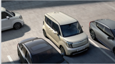
후방 교차 충돌방지 보조