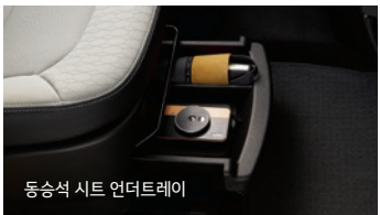
동승석 시트 언더트레이