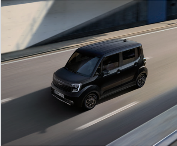
차로 유지 보조