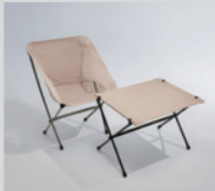
캠핑 의자 & 테이블