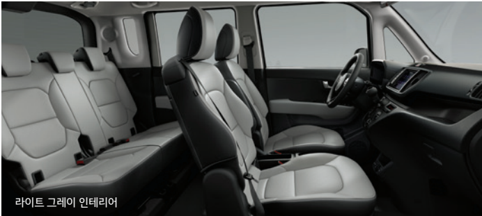
라이트 그레이 인테리어