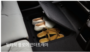
뒷좌석 플로어 언더트레이