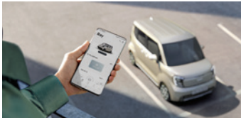
Kia Connect 원격 제어