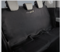
PET 방오시트 커버

※ 애프터마켓 상품은 기아 카앰라이프(kia.auton.kr)에서 구매 가능한 상품입니다.(기아멤버스 포인트 사용 가능) ※ 애프터마켓 상품의 상세 설명은 카앰라이프를 통해 확인 가능합니다. ※ 캠핑 의자 및 테이블은 각각 구매 가능합니다. ※ 애프터마켓 상품은 제조원 별도 보증 품목이며, 자세한 내용은 별도 제공되는 보증서를 참조하시기 바랍니다.