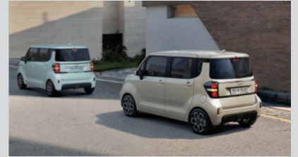
전방 충돌방지 보조 (차량/보행자)