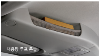
대용량 루프 콘솔