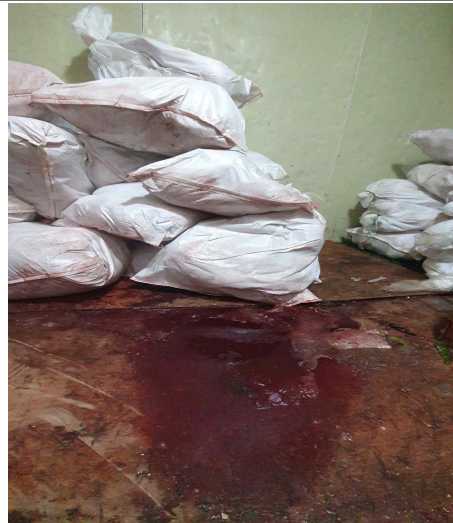
냉동창고 보관중인 축산물에서 핏물이 흘러나와 고여 있음