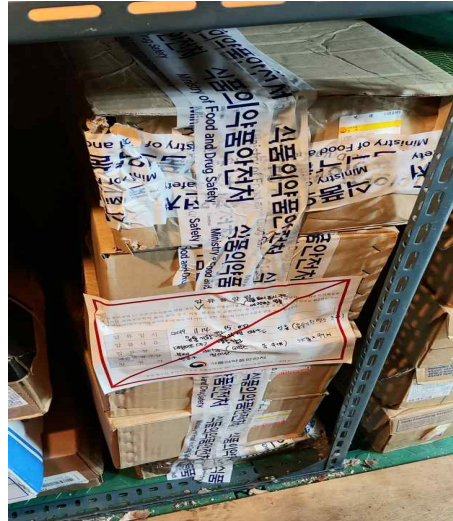
유통기한 변조 및 유통기한 경과 제품 판매