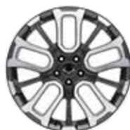
20인치 다이아몬드 커팅 휠 (타이어 : 245/45R20)