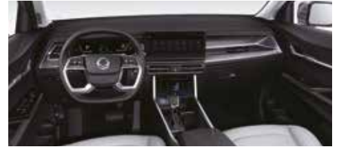
라이트 그레이 인테리어