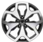
18인치 다이아몬드 커팅 휠 (타이어 : 235/55R18)