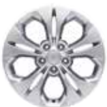
17인치 알로이 휠 (타이어 : 225/60R17)