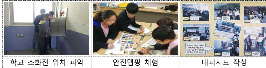
학교 소화전 위치 파악