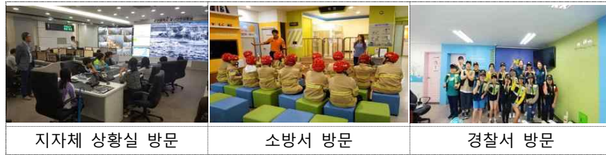
지자체 상황실 방문