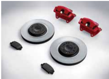
레드 캘리퍼 & 대용량 디스크 & 로우 스틸 패드