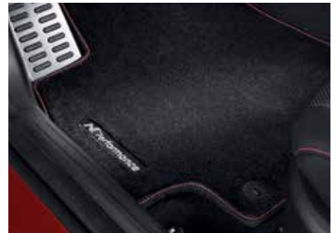
N로고 플로어 매트(1열, 2열)

※ 상기 N Performance parts 상품은 N Line차량에만 적용 가능합니다.