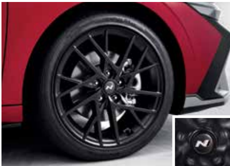
18인치 스포츠 디자인 휠 & N로고 스피닝 휠캡