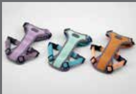
하네스 II (일상생활용, 소형/중형)