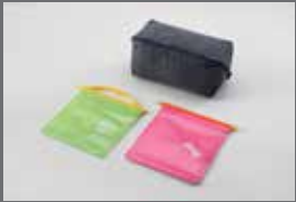
멀티파우치 & 포터블 포켓(먹이용/배변용)

* 커스터마이징 상품 애프터마켓 판매처: 현대 Shop(Shop.Hyundai.com) 현대 브랜드관